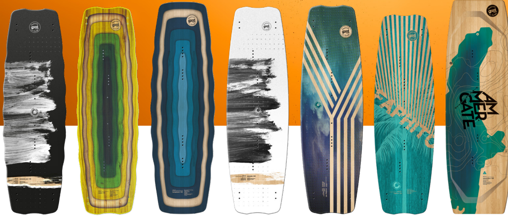
AMNESIA PRO freeride/freestyle