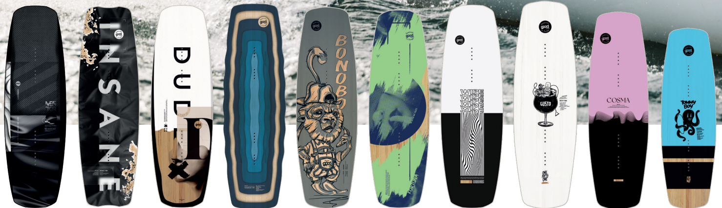
MENTOR inverts/boat/ obstacles